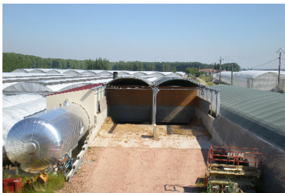
Aire de stockage