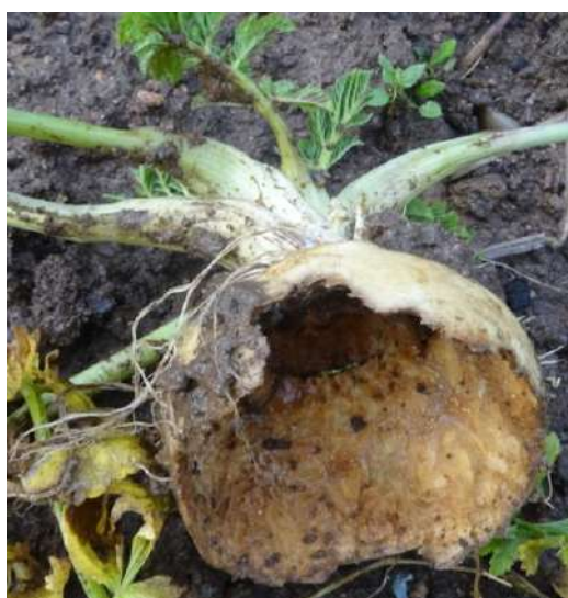
Dégâts sur céleri rave