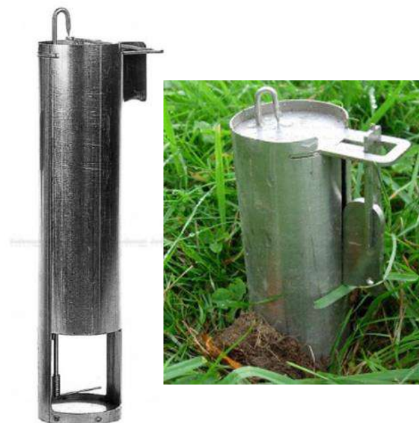
Piège Topcat de la société Andrematt

Ils sont très efficaces car ils ont un déclenchement sensible et rapide mais demandent également une surveillance quotidienne. Ils permettent de piéger les rongeurs dans les deux directions. Il y a un repère visuel pour voir les pièges qui ont capturé un rongeur. Une fois les rongeurs éliminés d'une parcelle, il est nécessaire de casser les galeries existantes pour retarder une éventuelle nouvelle infestation.