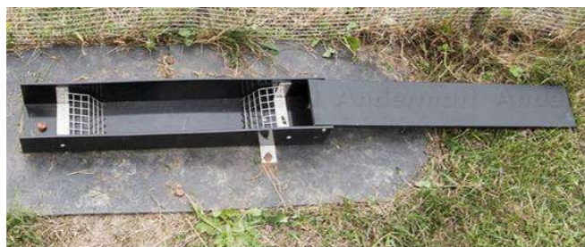
Piège Standby de la société Andermatt

Il faut une vérification quotidienne des pièges.