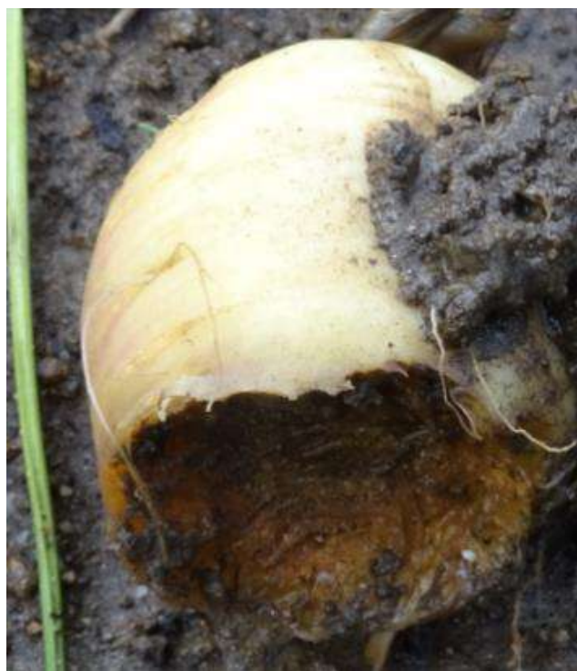
Dégâts sur panais