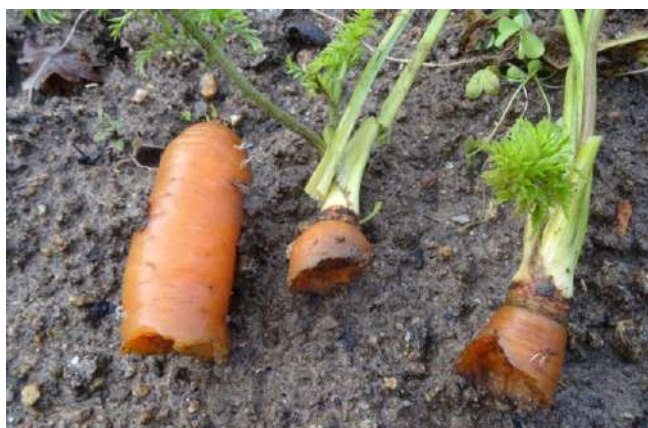
Dégâts sur carottes