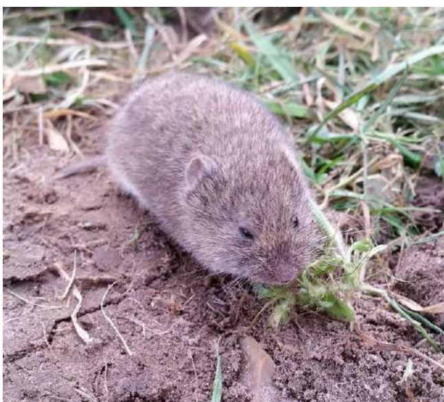
Campagnol des champs

Il existe 13 espèces de campagnols sur le territoire français, mais seulement deux sont présentes en milieu agricole : le campagnol des champs et le campagnol terrestre , appelé aussi rat taupier.