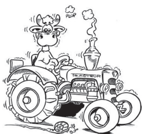
Pâturage : « Les vaches font le boulot »