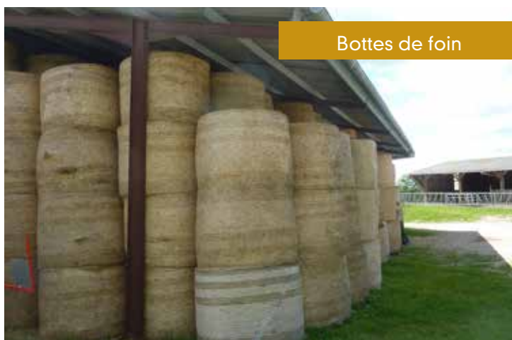
Bottes de foin

Surface de 3 cellules = 51 \times 3 + \text{espacements de } 1 \text{ m} = 160 \text{ m}^2 environ