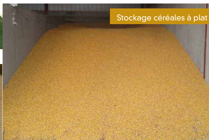
Stockage céréales à plat