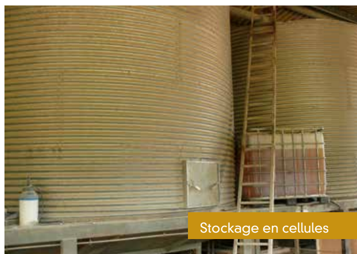
Stockage en cellules